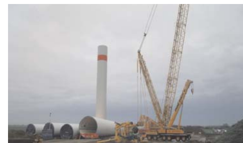
Windpark in Tantow, Brandenburg