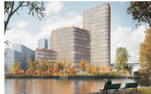
Bürogebäude DKB, UpBeat